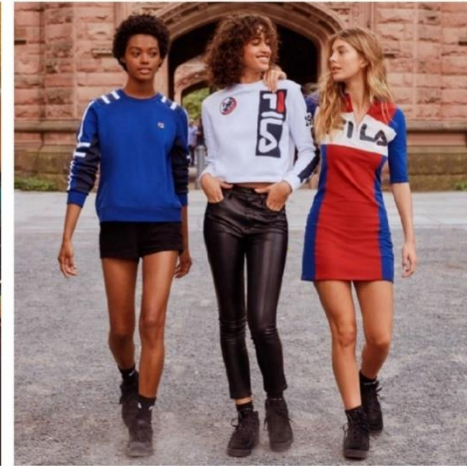
Exemple de post #fashionmix