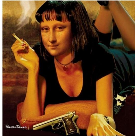
Exemple de post #wearemmv